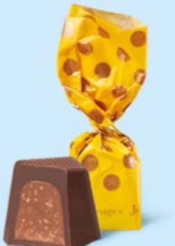
CHOCOLAT NOIR Praliné avec éclats de crêpe dentelle

BOITE DE 245 G NET 19 SUJETS ASSORTIS AU PRALINÉ 7 RECETTES