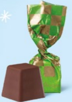
CHOCOLAT NOIR Praliné façon rocher aux éclats de noisettes