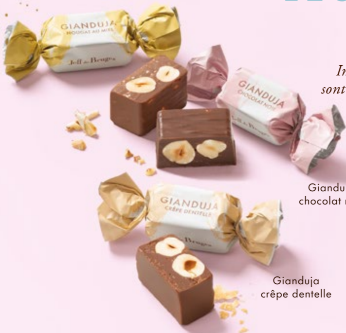
Gianduja nougat au miel