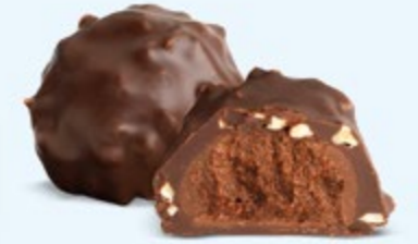
Praliné aux noisettes et éclats d'amandes, chocolat noir 60% de cacao

Éclats croustillants, praliné ultra fondant, finesse du chocolat d'enrobage... Les rochers sont les grands classiques de notre maison.