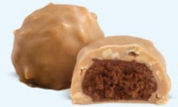
Praliné aux noisettes et éclats d'amandes, chocolat blanc caramélisé