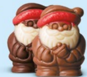
Duo praliné et caramel ou praliné et éclats de noisettes caramélisées