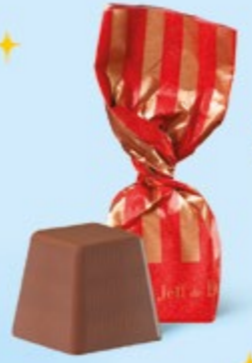
CHOCOLAT AU LAIT Praliné noisettes façon pâte à tartiner